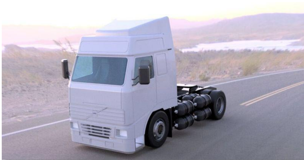
Figure 9 – Le prototype de poids lourd ULEMCo à moteur thermique à hydrogène (2018)

Malgré tous ces développements décourageants, la société britannique ULEMCo 5 a relancé ce mode d'alimentation en avril 2018 en présentant un poids lourd équipé d'un moteur VOLVO FH16 modifié pour être alimenté en hydrogène (cf. fig. 9). Les avantages mis en avant par cette société sont une très faible pollution (faibles émissions de NOx) et un faible surcoût comparé à un poids lourd équivalent à pile à combustible. D'une puissance disponible de 300 CV et équipé d'un réservoir de 17 kg d'hydrogène, son autonomie annoncée était de 300 km.