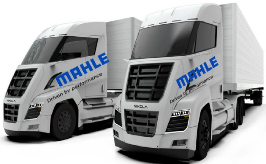
Figure 10 - Camions MAHLE (2020)

En juillet 2020 , le constructeur allemand MAHLE annonce souhaiter utiliser l'hydrogène dans ses camions (cf. Fig. 10) équipés de moteurs thermiques.