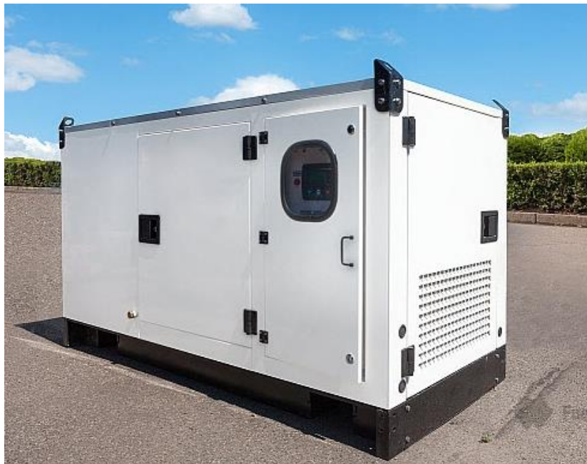
Figure 2 – Le prototype de groupe électrogène ULEMCo 50kW (2019)