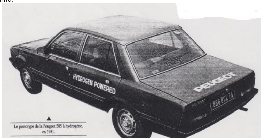
Figure 5 – Prototype Peugeot 505 à moteur thermique à hydrogène (1981)

Ainsi, Peugeot s'y était intéressé dès le début des années 1970 et avait présenté, en 1981, un prototype de son modèle 505 (cf. Fig. 5). L'hydrogène alimentant le moteur était stocké dans des hydrures ; mais leur poids élevé devant la masse d'hydrogène stocké ne permettait pas de disposer de ce dernier en quantité suffisante pour assurer une autonomie acceptable. Le projet a alors été abandonné.