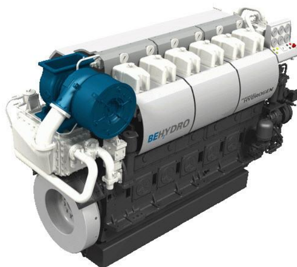
Figure 3 – Le moteur thermique à hydrogène BeHydro (2019)