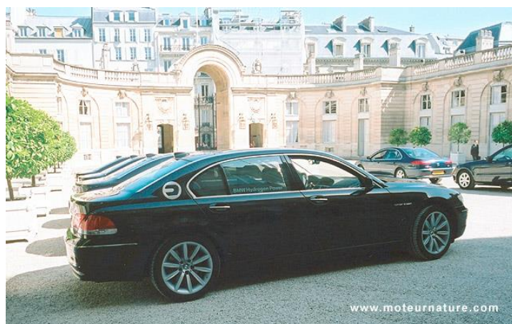
Figure 6 - La BMW 745 H reçue à l'Elysée en 2007

D'autres véhicules à moteur thermique à hydrogène ont été imaginés sur le modèle des voitures hybrides actuellement commercialisées. Ces dernières disposent d'un moteur thermique conventionnel, à essence ou gazole, associé à un moteur électrique alimenté par une batterie que recharge le moteur thermique. Ce moteur électrique fonctionne, soit seul sans aucun rejet ni aucun bruit (situation particulièrement intéressante en ville) soit, si nécessaire, apporte un supplément de puissance au moteur thermique. Ainsi, la voiture hybride à moteur thermique à hydrogène serait-elle une voiture propre dans ces deux modes de fonctionnement ! Plusieurs dizaines de tels véhicules ont été construits ( Ford , Mazda , Quantum , bus MAN dans le cadre du programme HyFleet-CUTE , en particulier) et testés en conditions réelles (cf. fig. 8), mais cette technologie n'a pas fourni aux constructeurs les satisfactions voulues et leurs développements ont été arrêtés au début des années 2010.