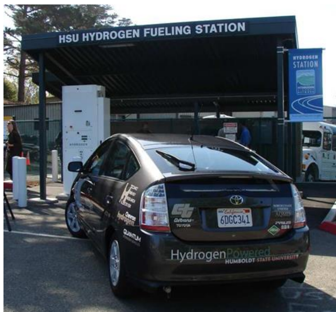
Figure 8 - La Toyota Prius modifiée par Quantum en 2008

Malgré tous ces développements décourageants, la société britannique ULEMCo 5 a relancé ce mode d'alimentation en avril 2018 en présentant un poids lourd équipé d'un moteur VOLVO FH16 modifié pour être alimenté en hydrogène (cf. fig. 9). Les avantages mis en avant par cette société sont une très faible pollution (faibles émissions de NOx) et un faible surcoût comparé à un poids lourd équivalent à pile à combustible. D'une puissance disponible de 300 CV et équipé d'un réservoir de 17 kg d'hydrogène, son autonomie annoncée était de 300 km.