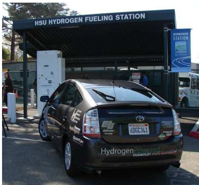
Figure 7 - La Toyota Prius modifiée par Quantum en 2008

Malgré tous ces développements décourageants, la société britannique ULEMCo 5 a relancé ce mode d'alimentation en avril 2018 en présentant un poids lourd équipé d'un moteur VOLVO FH16 modifié pour être alimenté en hydrogène (cf. fig. 8). Les avantages mis en avant par cette société sont une très faible pollution (faibles émissions de NOx) et un faible surcoût comparé à un poids lourd équivalent à pile à combustible. D'une puissance disponible de 300 CV et équipé d'un réservoir de 17 kg d'hydrogène, son autonomie annoncée était de 300 km.