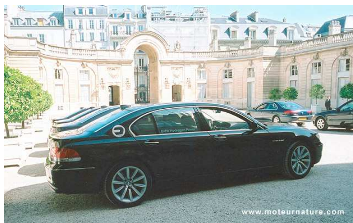
Figure 5 - La BMW 745 H reçue à l'Elysée en 2007