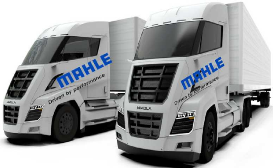
Figure 9 - Camions MAHLE (2020)

En Juillet 2020 , le constructeur allemand MAHLE annonce souhaiter utiliser l'hydrogène dans ses camions (cf. Fig. 9) équipés de moteurs thermiques.