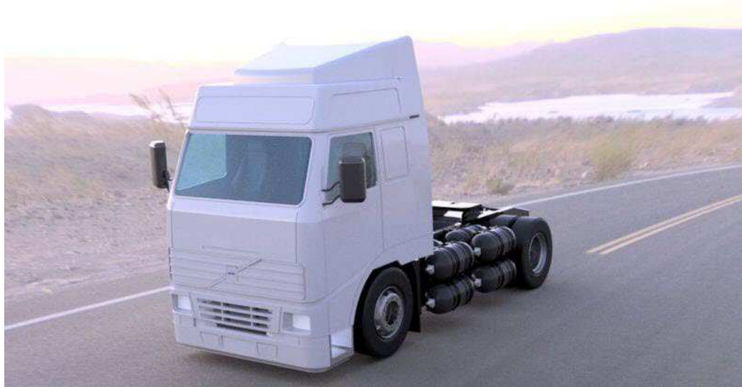
Figure 8 – Le prototype de poids lourd ULEMCo à moteur thermique à hydrogène (2018)

Malgré tous ces développements décourageants, la société britannique ULEMCo 5 a relancé ce mode d'alimentation en avril 2018 en présentant un poids lourd équipé d'un moteur VOLVO FH16 modifié pour être alimenté en hydrogène (cf. fig. 8). Les avantages mis en avant par cette société sont une très faible pollution (faibles émissions de NOx) et un faible surcoût comparé à un poids lourd équivalent à pile à combustible. D'une puissance disponible de 300 CV et équipé d'un réservoir de 17 kg d'hydrogène, son autonomie annoncée était de 300 km.