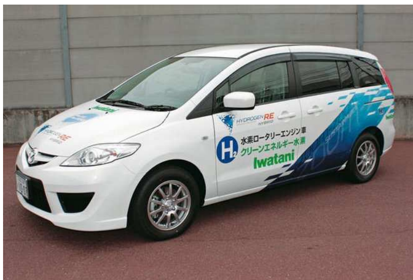
Figure 6 - La Mazda Premacy Hybrid en 2009