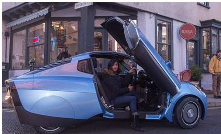
Figure 2 - le RASA de Riversimple (2017)

Néanmoins et récemment, en 2016, la petite société Riversimple 2 implantée au Pays de Galles, a dévoilé un prototype de petit véhicule baptisé RASA (cf. Fig. 2) conçu autour de composants étrangers : une pile à combustible canadienne Hydrogenics de 8,5 kWe, un réservoir de 1,5 kg d'hydrogène sous 350 bars (autonomie de 480 km) fabriqué par la PME française Ad-Venta, des supercapacités au Li-ion de JSR Micro belges, et quatre moteurs-roue de Printed Motor Works ... anglais. Il a été en partie développé dans le cadre d'un contrat FCH-JU. Une vingtaine d'exemplaires ont été fabriqués pour des tests.