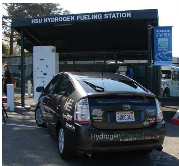
Figure 6 - La Toyota Prius modifiée par Quantum en 2008

Malgré tous ces développements décourageants, la société britannique ULEMCo 5 a relancé cette technologie en avril 2018 en présentant un poids lourd équipé d'un moteur VOLVO FH16 modifié pour être alimenté en hydrogène (cf. fig. 7). Les avantages mis en avant par cette société sont une très faible pollution (faibles émissions de NOx) et un faible surcoût comparé à un poids lourd équivalent à pile à combustible. D'une puissance disponible de 300 CV et équipé d'un réservoir de 17 kg d'hydrogène, son autonomie annoncée était de 300 km.