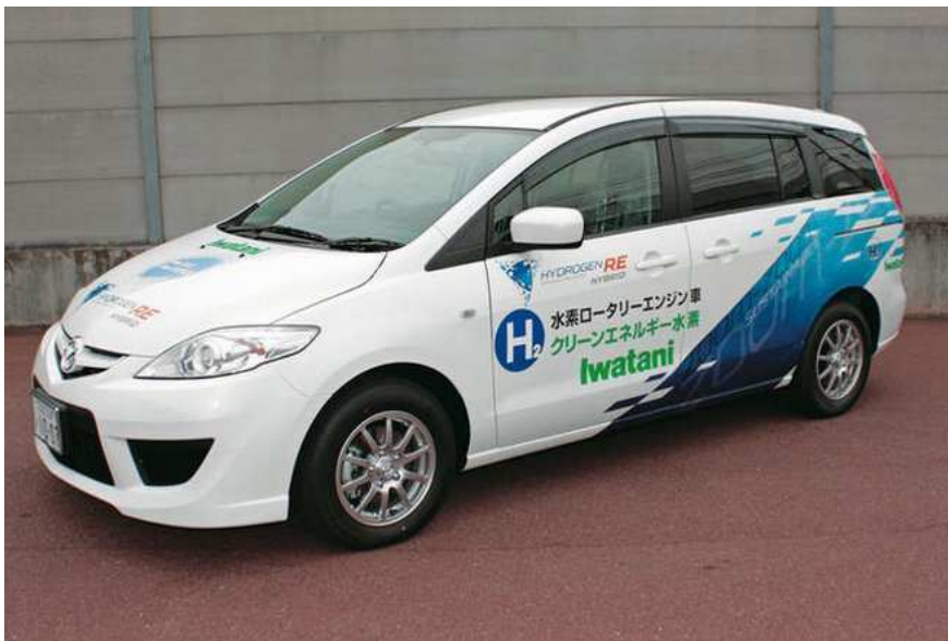
Figure 5 - La Mazda Premacy Hybrid en 2009