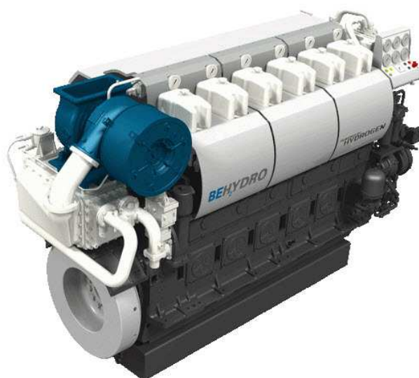
Figure 3 – Le moteur thermique à hydrogène BeHydro (2019)