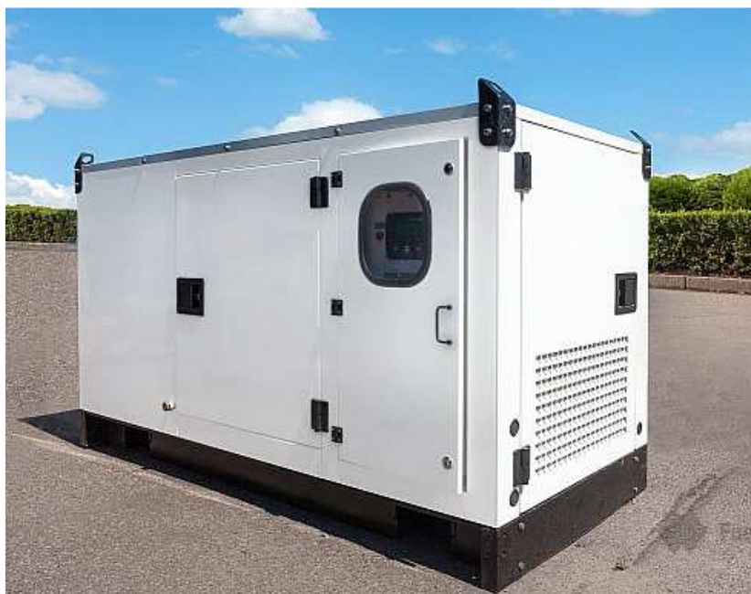
Figure 2 – Le prototype de groupe électrogène ULEMCo 50kW (2019)