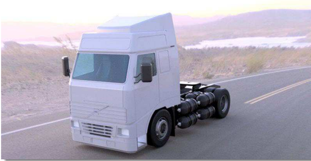
Figure 7 – Le prototype de poids lourd ULEMCo à moteur thermique à hydrogène (2018)